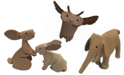
ワークショップでつくれるよ!

1995年1月17日、兵庫県南部を襲った大地震から、まもなく30年を迎えます。芦屋市立上宮川文化センターには震災当時、地区内外合わせて延べ400人が駆け込み、約4カ月間に及び共同生活が始まりました。震災時、上宮川文化センターが隣保館として果たした役割を、パネルをとおしてふりかえります。